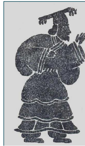
Император Яо из кн. М.Е. Кравцовой

164.]. В легенде «Великий лучник по имени И» показаны основные добродетели мудрого правителя Яо, «который отличался большой