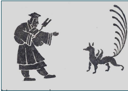
Сяский Юй из кн. М.Е. Кравцова

Э.М. Яншина обратила внимание, что Шунь «также отдал престол не сыну, а наиболее достойному своему сподвижнику – Великому Юю» [5, с. 14]. В книге «История культуры Китая» уточняется, что, кроме Жёлтого императора и его потомков, в качестве «совершенного мудрого государя» в конфуцианско-историологической традиции также особо почитается