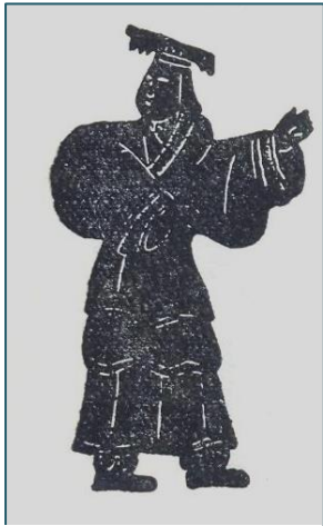
Жёлтый император Хуан-ди из кн. М.Е. Кравцовой

стрел, обучение людей искусствам строительства, изготовление гончарных изделий, приготовление пищи, а также изобретение транспортных средств (колесница и лодка)» [1, с. 163].